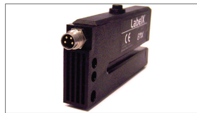
行业标准接头、接线和装配构成